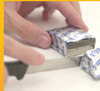
1- SE CORTA

Te recomendamos limpiarla utilizando alcohol para eliminar grasa, aceite o restos del lijado.