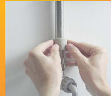
3- SE APLICA

Una vez aplicada endurece en 10 minutos.