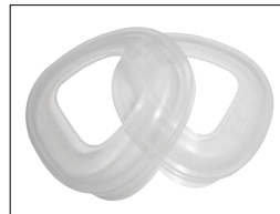
Retenedor de almohadilla de filtro