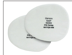
Almohadilla de filtro P95